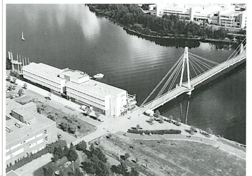
Yövyimme kuvassa olevassa Hotelli Albassa, jonka läheisyydessä tapahtuu myös virallinen kokoontuminen Yliopiston tiloissa. Molemmat sijaitsevat Jyväsjärven rannalla Mattilanniemessä.

Toivotan omasta ja kaupungin puolesta Vesteristen sukukokoukseen osallistujat lämpimästi tervetulleiksi Jyväskylään. Sukuun kuuluvia jäseniä onkin Jyväskylässä ja Keski-Suomessa runsaasti jo useamman sukupolven ajalta.