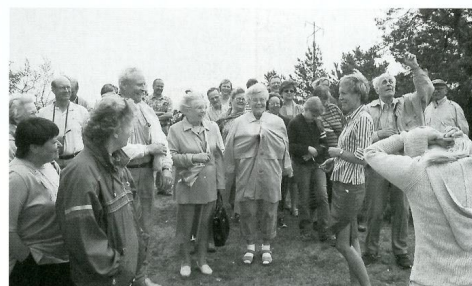
Kyllä meillä oli mukavaa!